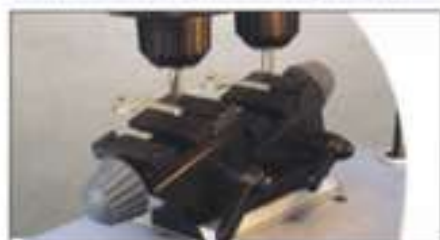
Blocco, Block, Blocage, Blockierung, Bloqueo.