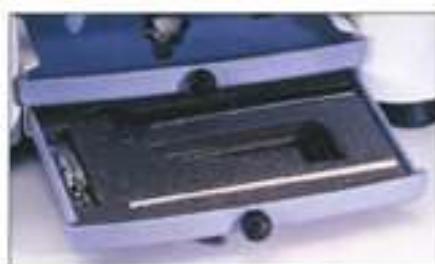
Slottos Release, Débloqué, Entpernung, Desbloqueo.