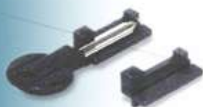
● M001A505 Citroen (SM7-8)