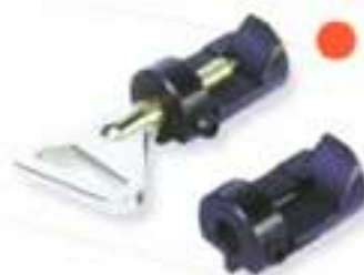
● M001A502 Renault (NE 66)